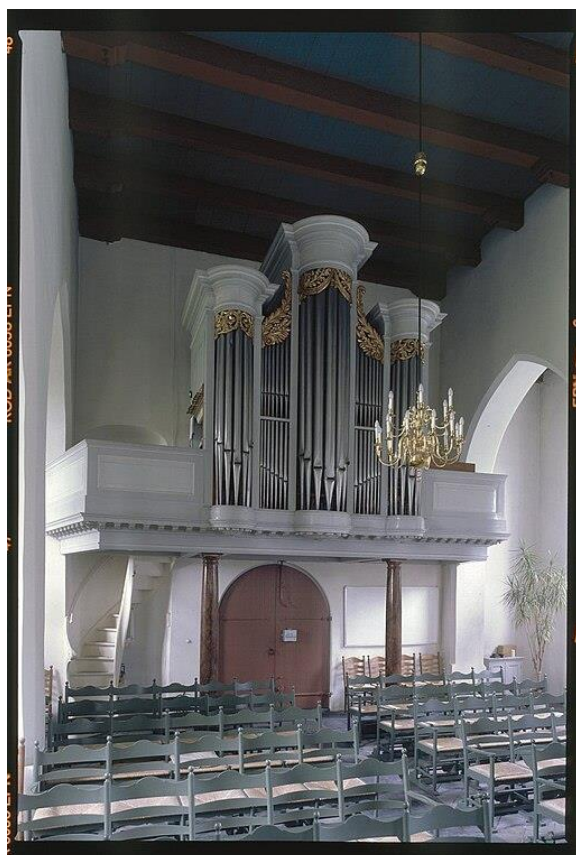
Bommel foto beeldbank RCE

1834, Bommel, Hervormde Kerk, renovatie van het orgel uit 1775 door “Keurten en Stöcker”. Het is gekeurd door organist De Vries uit Nijmegen. 13 De negen registers zijn op een merkwaardige manier verdeeld over twee klavieren, met een Dulciaan 4' als tongwerk. Kerk en orgel liepen in 1944 zware oorlogsschade op. Van het orgel bleef eigenlijk alleen de kas bewaard, de rest is later weer toegevoegd. Deze kas met het front worden aan Kuerten en Stöcker toegeschreven.