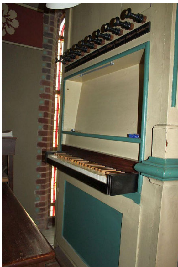
Weurt claviatuur