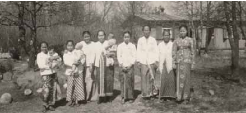
Sarongs en Kabaja's in Kamp Ybenheer