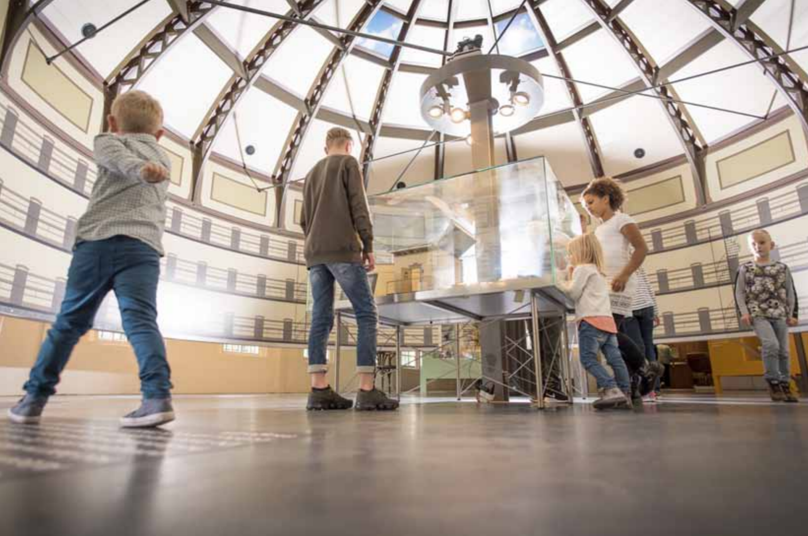
Koepel in het Gevangenismuseum

“Gevangenisdorp met prachtige oude gebouwen met een historisch verleden zeker een aanrader. Ook de uitgezette wandelingen zijn erg mooi en afwisselend.”