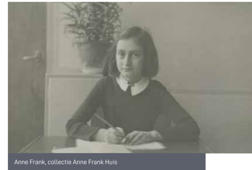
Anne Frank

Belangrijk doel van de tentoonstelling was om bezoekers uit te dagen en na te laten denken over onderwerpen als identiteit, vooroordelen en discriminatie. Voorafgaand aan de periode dat de tentoonstelling was te zien zijn gedetineerden opgeleid tot rondleider. Waardoor er een bijzondere dialoog ontstond tussen bezoekers en gedetineerden over onderwerpen als uitsluiting en opsluiting, onderwerpen die ook nu uiterst actueel zijn.