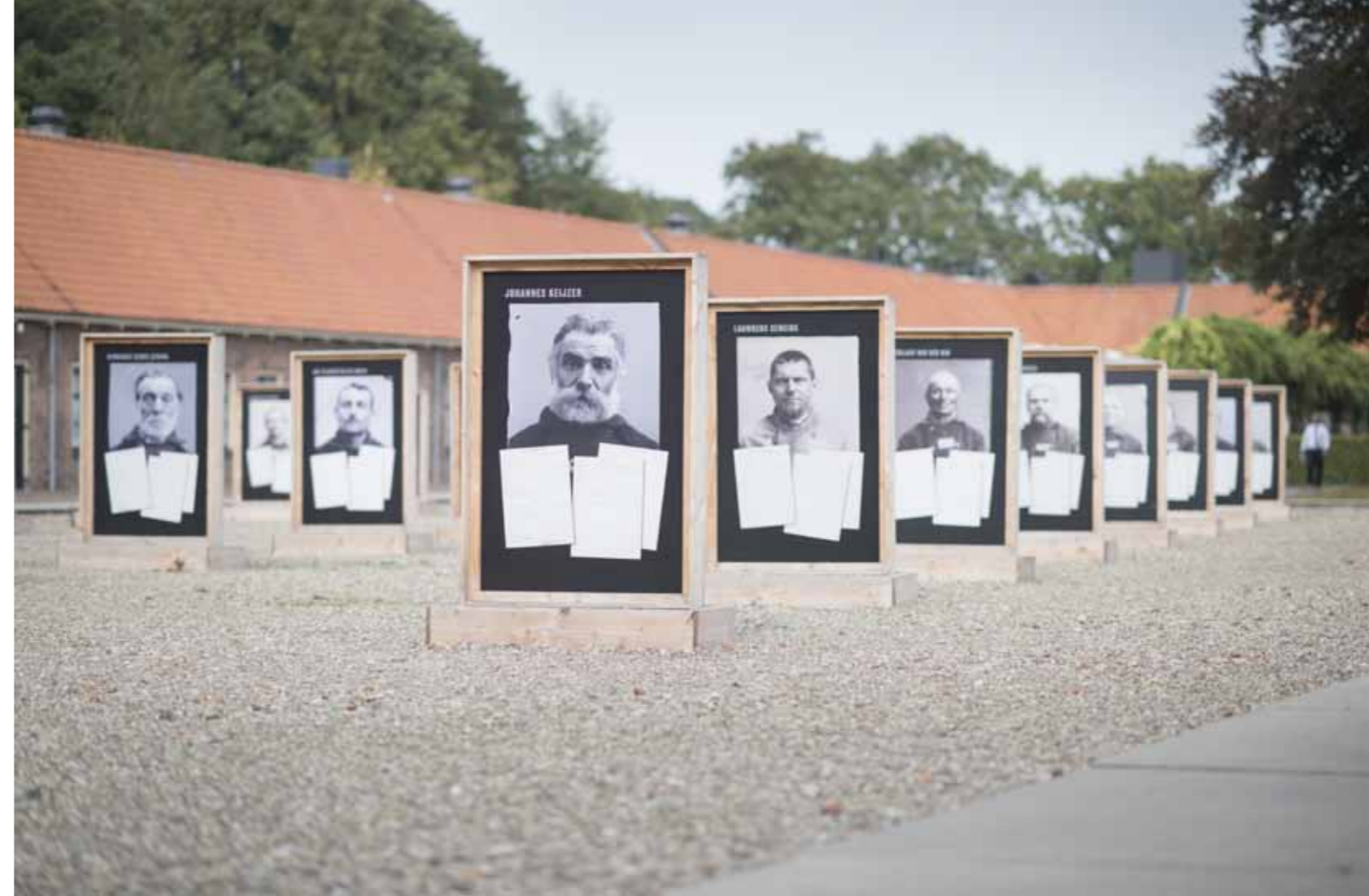
Signalementskaarten op de binnenplaats van het museum

Het Gevangenis­museum organiseerde Oktober Kindermaand dit jaar in samenwerking met Viesueel Geweld. Dit bedrijf uit Groningen maakt visuals voor evenementen en bedrijven. In oktober verzorgde Viesueel Geweld de workshop de Filterfabiek in het museum. Een interactieve workshop waarin kinderen zelf een boevenmasker konden ontwerpen en digitaal op hun gezicht plaatsen. Kinderen konden daar vervolgens een filmpje van maken wat ze thuis terug konden kijken en op de social media delen.