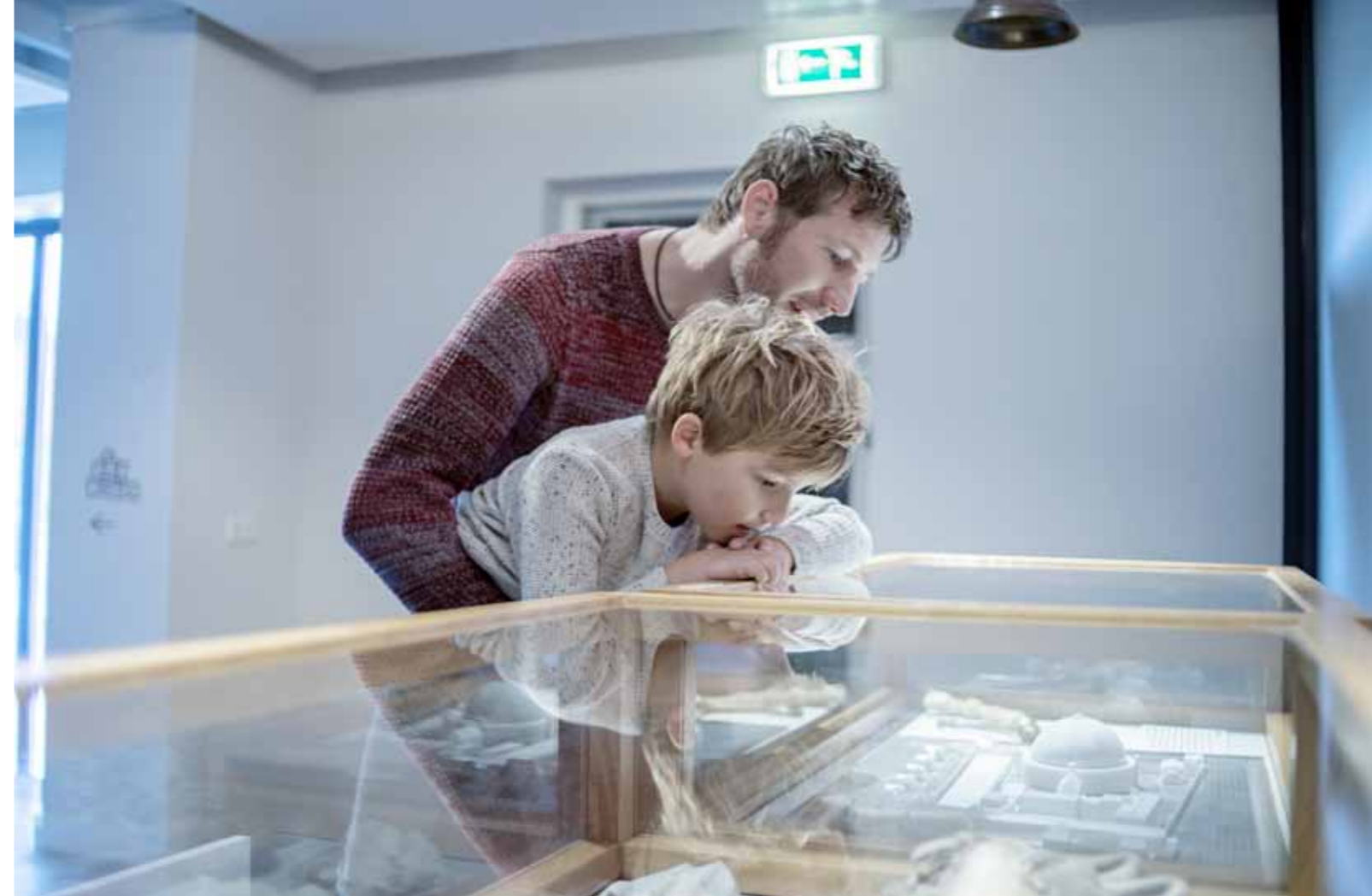
Bezoekers in het Gevangenis­museum

Mevrouw H.W. (Helma) Hoving, toegeleden in 2020