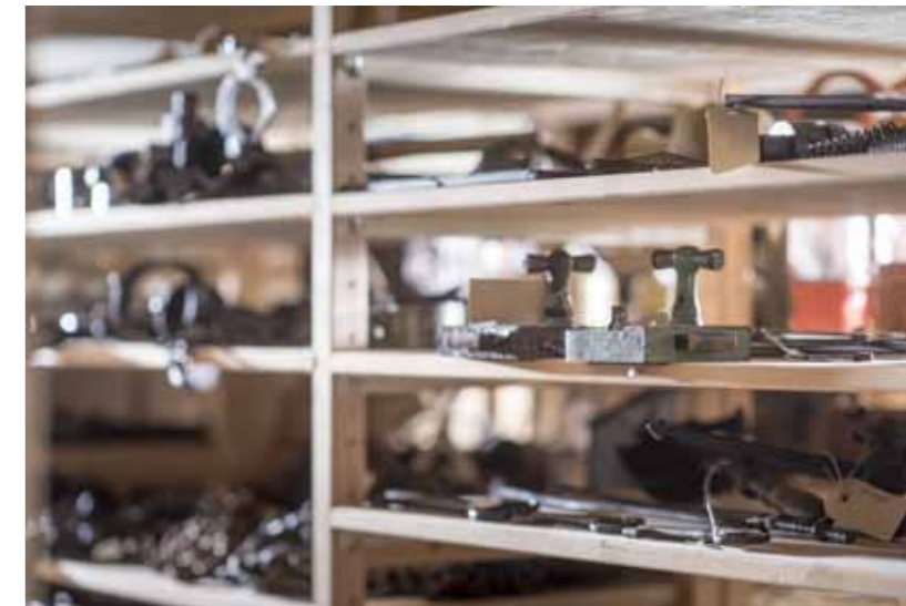
Collectie in het depot