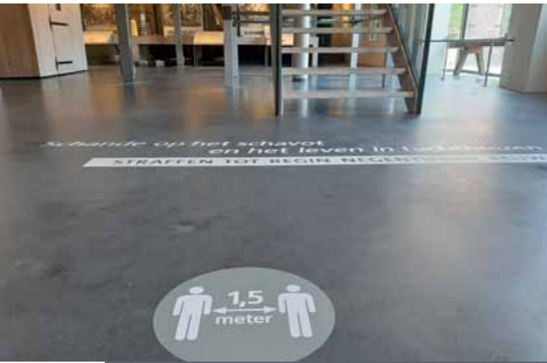
Corona maatregelen in het museum

CORONA Net als alle andere musea en culturele instellingen had het Gevangenis-museum door corona een heel ander jaar dan van tevoren gepland. Veel grote, jaarlijks terugkerende, evenementen zoals de Bajesdag konden helaas niet doorgaan en ook het theaterspektakel het Pauperparadijs kon niet opgevoerd worden op de binnenplaats van het museum.